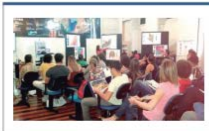
FIGURA 7: Exposição "A Cartografia na CPRM" - ERJ.

Realizada de 21 a 23 de junho, nas unidades regionais da CPRM/SGB, com o tema "CPRM e Você Fazendo Sustentabilidade", a IV Semana do Meio Ambiente enfatizou a integração das diferentes áreas da CPRM através do desenvolvimento de seus respectivos trabalhos à luz da Sustentabilidade, fomentando também o engajamento e reflexão de nossos(as) colaboradores(as) (figura 7).