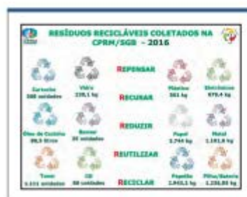
FIGURA 9: Dados Coleta Seletiva Solidária (Resíduos Recicláveis).

Atendendo aos termos da legislação vigente sobre o assunto, o material reciclável recolhido nas unidades da empresa, é destinado a cooperativas e associações de catadores de materiais recicláveis. Há também o recolhimento de medicamentos válidos e vencidos, que são doados para instituições filantrópicas e recebem descarte ambientalmente adequado, respectivamente (figuras 9 e 10).